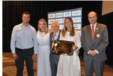
Momento de la entrega del Premio