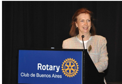
Diana Elena Mondino