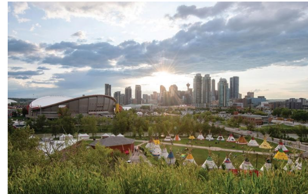
Elbow River Camp, en las instalaciones del Calgary Stampede, celebra la cultura de las Primeras Naciones.

La Convención de Rotary International regresa por segunda vez a Calgary, sede de los Juegos Olímpicos de Invierno de 1988 y una ciudad conocida por su cultura ciclista y su fuerte herencia indígena. Los clubes aprovecharán el evento emblemático de Rotary, que se celebrará del 21 al 25 de junio, para fomentar el número de miembros y el interés en trabajar con la organización, al tiempo que intercambiarán ideas con los asistentes sobre cómo hacer lo mismo en sus ciudades de origen, ya sea Toronto o Tokio. Saldrás renovado con la inspiración del Plan de Acción para hacer de tu club el lugar ideal.