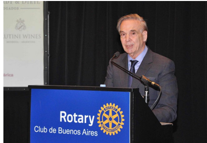
Miguel Ángel Pichetto