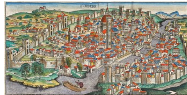
Vista de Florencia, según un grabado del Liber chronicarum (1493), en los primeros años de Miguel Ángel.

Nació el 6 de marzo de 1475 en Caprese, una villa de la Toscana cercana a Arezzo. Fue el segundo de cinco hijos varones de Ludovico di Leonardo Buonarroti di Simoni y Francesca di Neri del Miniato di Siena. Su madre falleció en 1481, cuando él tenía seis años.